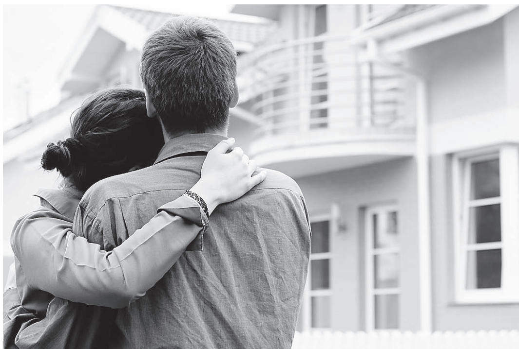
Ежегодные взносы за хороший особнячок могут составлять и 30 тысяч рублей в год, и 50, и 100 тысяч. Но зато, если дом сгорит, хозяин получает полноценное возмещение

Экономия на страховых выплатах, рискуешь потерять больше