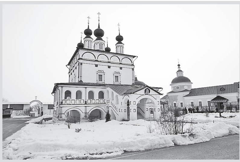
2 апреля митрополит Ювеналий посетил с архипастырским визитом Свято-Троицкий Белопесоцкий монастырь и возглавил Божественную литургию в Троицком соборе обители. Владике митрополиту сослужил епископ Серпуховской Роман, благочинный Ступинского округа священник Александр Краля, иеромонах Николай (Летуновский) и духовенство обители.